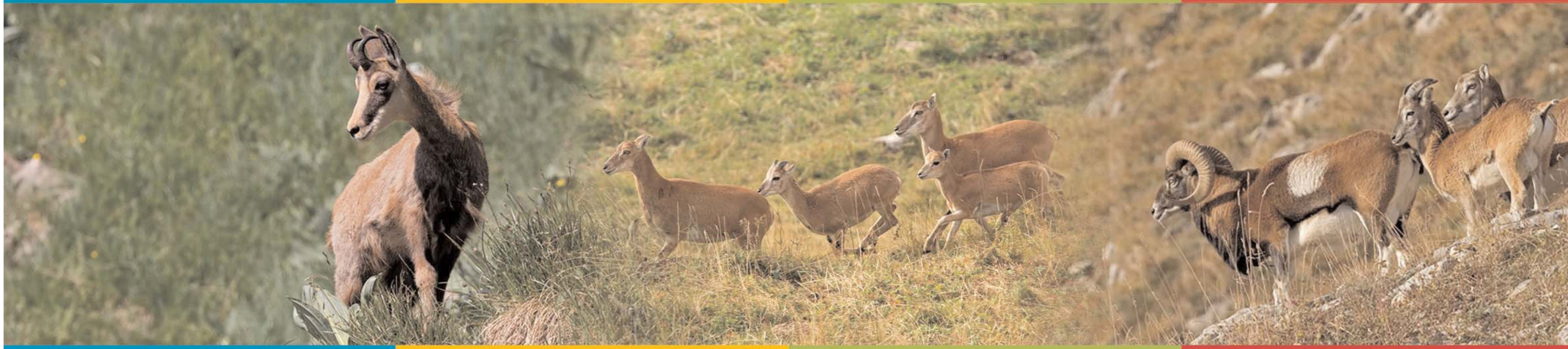
Tableau de chasse grand gibier

L'examen des animaux tués à la chasse et le relevé de mesures fournissent de nombreuses informations utiles à la gestion des populations.