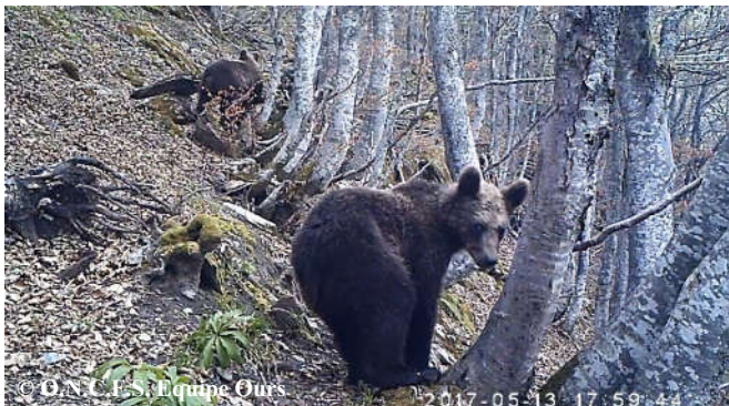
Photo de 2 ours subadultes de 1,5 an, extraite d'une vidéo automatique, réalisée le 13 mai 2017 sur la commune de Seix (09)