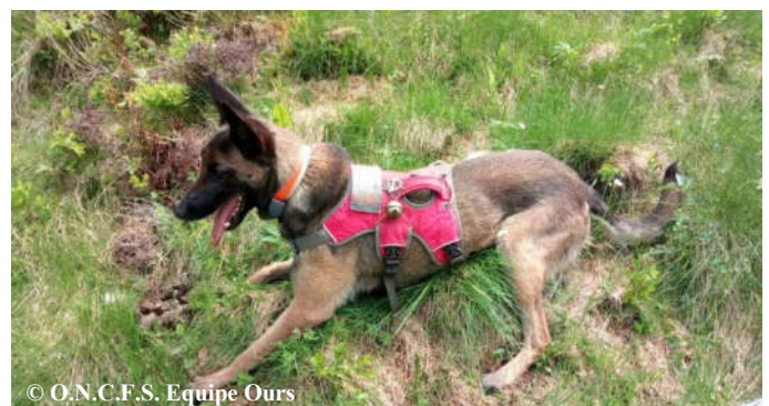
Iris au marquage d'une des 8 crottes qu'elle a trouvées lors de la vérification de 3 témoignages d'observations directes d'un ours sur la commune d'Aulus les Bains (09).

29 séries de photos-vidéos automatiques ont été relevées en mai 2017. Celles-ci ont permis de détecter au moins 10 individus dont Néré, Bonabé, une femelle suivie d'un mâle adulte (Pépite possible), Boet probable, une femelle (Nheu possible) suivie d'au moins 2 de ses jeunes nés en 2016... Ces derniers peuvent correspondre aux 2 individus (photo ci-contre), filmés 11 jours plus tard, à 10 km de distance, après dispersion du groupe familial. Une sélection de photos et vidéos automatiques, classée par mois, est consultable sur notre site internet ONCFS ainsi que sur la chaîne Youtube ONCFS .