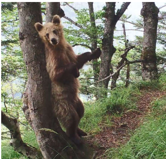
Photo extraite d'une vidéo automatique d'un ours subadulte de 1,5 an, le 17 juillet 2019 à 8h45, sur la commune de Sentein (09).

91 séries de photos-vidéos automatiques ont été relevées lors de ces 3 derniers mois. Une sélection de ces dernières est consultable sur notre site internet ONCFS ainsi que sur la chaîne Youtube ONCFS .