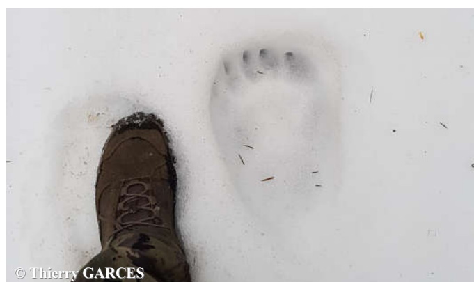
Empreinte d'ours trouvée par un randonneur le 30 mars 2018 sur la commune de Sainte Colombe sur Guette (11).

Dans les Pyrénées centro-orientales, les premiers indices ont été relevés le 25 mars sur la commune d'Aragnouet (65) où une piste d'ours mâle adulte, estimée de la nuit passée, a été découverte par une randonneuse. Une vidéo automatique de cet ours, datée du 25 mars à 22h27, a par la suite été relevée un peu plus loin sur la commune de St Lary Soulan (65). Dans le flot de témoignages reçus et vérifiés en ce début de printemps, 4 d'entre eux ont aussi permis de confirmer la présence d'un ours sur la partie orientale des Pyrénées. Quatre pistes d'ours de taille moyenne (probablement un même individu de classe subadulte) ont effectivement été relevées, entre le 30 mars et le 10 avril 2018, sur les communes de St Colombe sur Guette (11), Rouze (09), Puyvalador (66) et Quérigut (09).