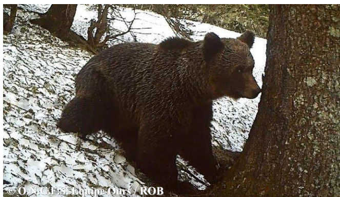
Photo automatique de l'ours Boet, extraite d'une vidéo automatique réalisée le 07 avril 2018, sur la commune de Fos (31).

18 séries de photos-vidéos automatiques ont été relevées début 2018. Celles-ci ont permis de détecter au moins 7 individus dont Néré probable dès le 29 janvier sur Laruns (64), Bonabé sur Melles (31), Boet sur Fos (31) et Pépite probable sur Sentein (09). Une sélection de photos et vidéos automatiques, classée par mois, est consultable sur notre site internet ONCFS ainsi que sur la chaîne Youtube ONCFS .