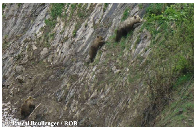
Photo d'une ourse suivie de ses deux oursons de 18 mois réalisée, le 29 mai 2018 à 9h45, commune de Couflens (09).

Une sélection de photos et vidéos automatiques, classée par mois, est consultable sur notre site internet ONCFS ainsi que sur la chaîne Youtube ONCFS .