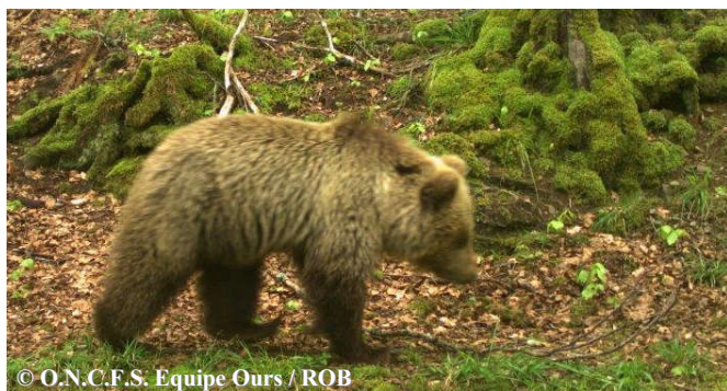
Photo automatique d'un ours subadulte, le 06 mai 2018 à 15h42, commune de Seix (09).