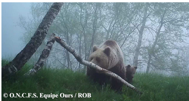
Photo extraite d'une vidéo automatique d'une ourse suivie de 2 oursons de l'année, enregistrée le 30 mai 2018 à 20h17, commune de Bonac Irazein (09).