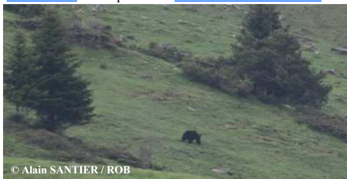
Photo d'un ours mâle adulte réalisée le 31 mai 2018 à 19h05 dans le Val d'Aran par un bénévole du ROB.

34 séries de photos-vidéos automatiques ont été relevées. Elles ont permis d'identifier 6 mâles (Néré, Cannellito, Bonabé, Pépite, Boet et Rodri probables), 2 ourses indéterminées suivies d'1 mâle, 1 ourse suivie de 2 oursons de 1,5 an, 1 ou 2 ourses suivies de 2 (photo ci contre) et 3 oursons de l'année. La proximité géographique de ces dernières ne permet pas de certifier l'existence de 2 portées distinctes. Une sélection de photos-vidéos classée par mois, est consultable sur le site internet ONCFS ainsi que sur la chaîne Youtube ONCFS .