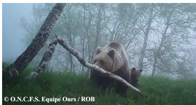
Photo extraite d'une vidéo automatique d'une ourse suivie de 2 oursons de l'année, enregistrée le 30 mai 2018 à 20h17, commune de Bonac Irazein (09).