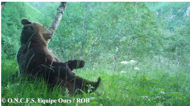
Photo, extraite d'une vidéo automatique, d'un ours mâle adulte (Pépite probable) le 26 juin 2018 à 07h01, commune de Bonac Irazein (09).