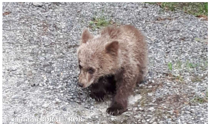
Photo de l'ourson orphelin dénommé « Mellous » le 05 juillet 2018 sur la commune de Fos (31).

Dans les Pyrénées centro-orientales, l'actualité a été marquée par la découverte, le 05 juillet, d'un ourson orphelin de 6 mois sur la commune de Fos (31). Malgré les soins qui lui ont été prodigués, ce dernier n'a pas survécu. Il a été retrouvé mort le 23 juillet sur la commune de Melles (31) où il avait été relâché après avoir été soigné et nourri pendant 6 jours. L'objectif était d'essayer au maximum de maintenir l'ourson dans son milieu naturel et lui éviter une éventuelle captivité à vie ( voir communiqué de presse du 25 juillet 2018 ).