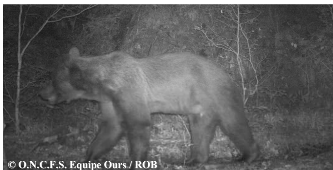
Photo automatique de l'ours Rodri, le 23 août 2018 à 22h41, sur la commune d'Estaing (65).

Une sélection de photos et vidéos automatiques, classée par mois, est consultable sur notre site internet ONCFS ainsi que sur la chaîne Youtube ONCFS .