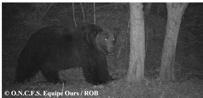
Photo automatique de l'ours Néré, le 25 octobre 2018 à 06h06, commune d'Estaing (65).