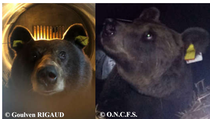
Photos des ourses Sorita (gauche) et Clavérina (droite), dans leur cage de transport, lors du voyage vers les Pyrénées françaises.

Une sélection de photos et vidéos automatiques, classée par mois, est consultable sur notre site internet ONCFS ainsi que sur la chaîne Youtube ONCFS .