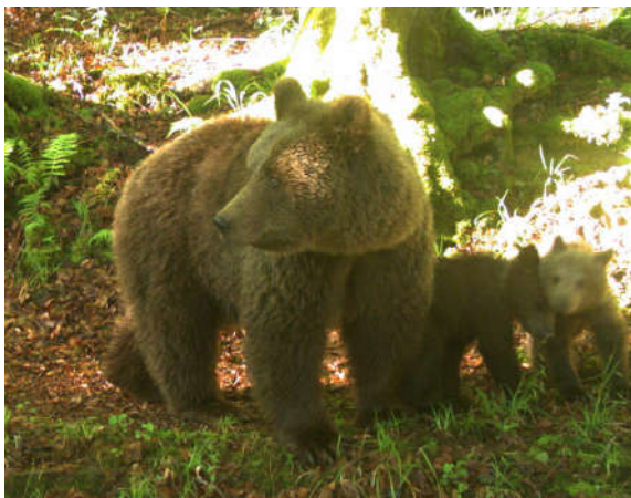
Photo automatique d'une ourse suivie de 2 oursons de l'année, le 12 juin 2019 à 8h18, commune de Seix (09).

81 séries de photos-vidéos automatiques ont été relevées début 2019. Une sélection de ces dernières est consultable sur notre site internet ONCFS ainsi que sur la chaîne Youtube ONCFS .