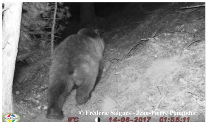
Photo automatique d'un ours indéterminé, le 14 août 2017 à 01h55, sur la commune de Fontrabieuse (66).

Les derniers indices de femelles suitées collectés au mois d'août, de part et de d'autre de la frontière, nous permettent de confirmer la présence d'au moins 3 portées composées respectivement d'1, 2 et 2 oursons de l'année. La présence d'une 4ème portée est plausible mais doit toutefois être confirmée notamment par la génétique.