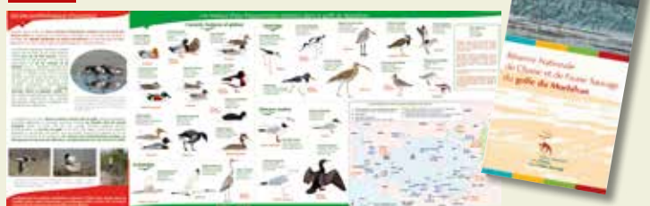
Deux exemples de plaquettes réalisées sur le site, la RNCFS et les oiseaux du golfe.

Enfin, le golfe du Morbihan fait l'objet de diverses couvertures médiatiques (télévisions, presse écrite...) et s'avère être un territoire abondamment évoqué dans les médias locaux.