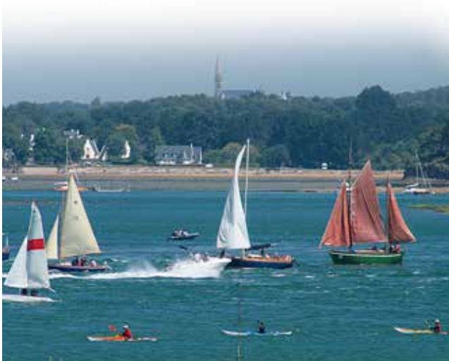
Le golfe du Morbihan est un cas d'école en matière de cumul d'activités et d'usages. Cette photo a été prise en mai 2011, pendant la « Semaine du golfe », une importante manifestation nautique.