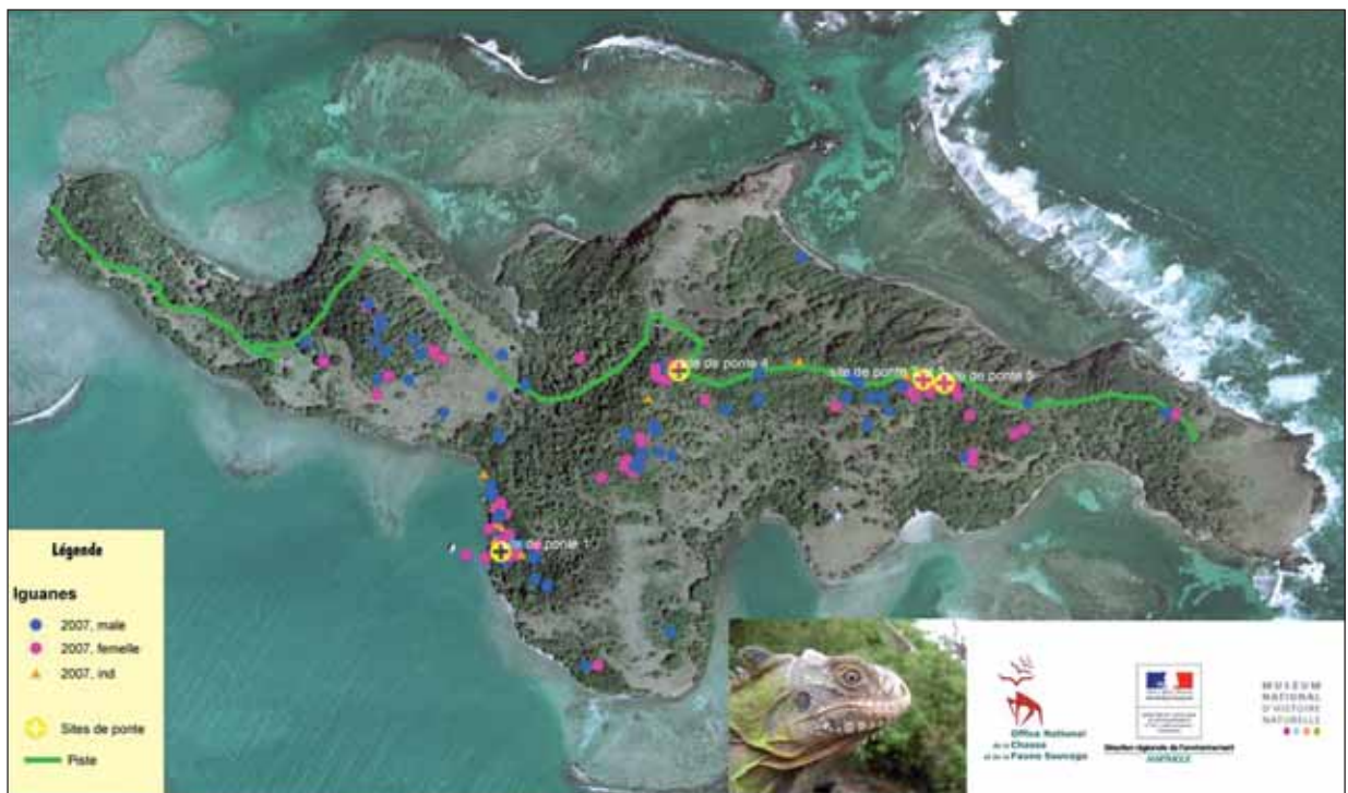
Carte 2 – Localisation des iguanes capturés sur l'îlet Chancel (avril-août 2007)

(végétation appréciée des iguanes, structuration de l'habitat, absence de prédateurs et d'iguanes verts, sites favorables à la ponte et améliorés début juillet 2006).