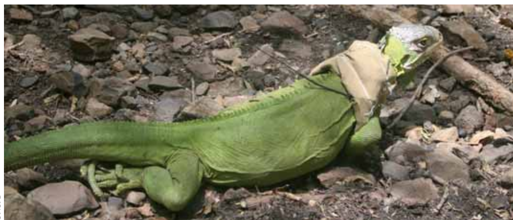
Femelle équipée d'un émetteur.

4 - Ce projet a été validé par le Comité scientifique régional pour le patrimoine naturel (CSRPN) le 21 octobre 2005, puis par le Conseil national pour la protection de la nature (CNP) le 25 avril 2006. La démarche est pilotée par l'ONCFS en partenariat avec la DIREN, le Ministère de la Défense et le Conservatoire du littoral - prochainement propriétaire de l'îlet.