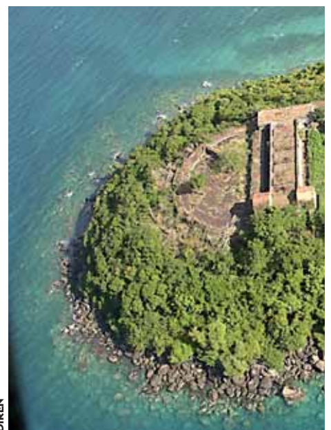
Vue aérienne de l'îlet à Ramier.

Cette dispersion, à la fois naturelle et anthropique, pose des problèmes en termes de stratégie de lutte contre une espèce invasive. D'actualité, ce sujet de compétition interspécifique rejoint l'initiative de l'UICN pour les espèces envahissantes.