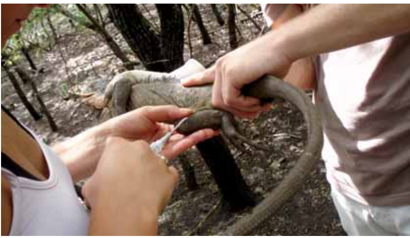
Injection d'un PIT (Passive Integrated Transponder) en sous-cutané.

pation du territoire (dispersion, domaines vitaux...) et d'appréhender les déplacements des mâles et des femelles en période de reproduction (distances, secteurs privilégiés...). Les données des deux années de suivis ont mis en avant : une répartition coloniale (quatre sites de peuplement privilégiés, carte 2 ), un mode de vie arboricole et une répartition hétérogène entre mâles et femelles. Les mâles ont un comportement territorial ; les femelles, quant à elles, parcourent de grandes distances pour rejoindre un site de ponte.