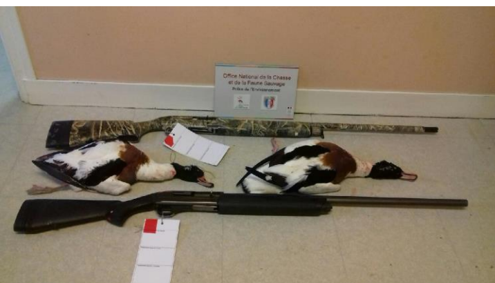
Armes et tadornes saisis