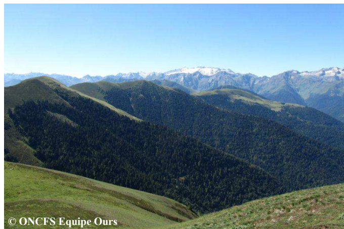
Crête frontière avec le Val d'Aran, rive gauche de la Garonne.

Une sélection de photos et vidéos automatiques, classée par mois, est consultable sur notre site internet : http://www.oncfs.gouv.fr/Photos-et-vidéos-dOurs-Brun-dans-les-Pyrénées-et-nbsp-ru533/Images-dOurs-brun-en-2015-ar1804