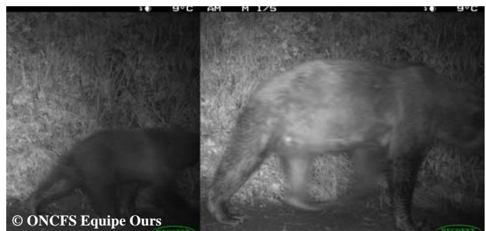
Photos automatiques d'une ourse et de son ourson de l'année, le 02 août 2015, commune de Bonac Irazein (09).

Depuis le mois de mai, de part et d'autre de la frontière des Pyrénées centrales, diverses observations visuelles et photos automatiques attestent de la présence de plusieurs femelles suitées. Trois portées (de 1, 2 et 3 oursons de l'année) peuvent être différenciées avec certitude (voir flashs infos). Par contre, les photos automatiques du 02 août ci-contre, ne permettent pas encore de valider l'existence d'une éventuelle 4ème portée. En effet, bien que la distance soit importante (32 km à vol d'oiseau), il peut s'agir de la même portée que celle filmée en fuite, par un groupe de randonneurs, le 20 juin 2015 dans la vallée de Venasque. La présence simultanée d'un autre ours (photos de randonneurs), présumé mâle, sur cette même zone pourrait avoir entraîné cette femelle à effectuer de nombreux kilomètres pour protéger sa progéniture (ex : déplacement de Mellba et ses 3 oursons, sur 29 km à vol d'oiseau, en 1997). Toutefois, seules des analyses génétiques pourraient confirmer ou infirmer ces différentes hypothèses.