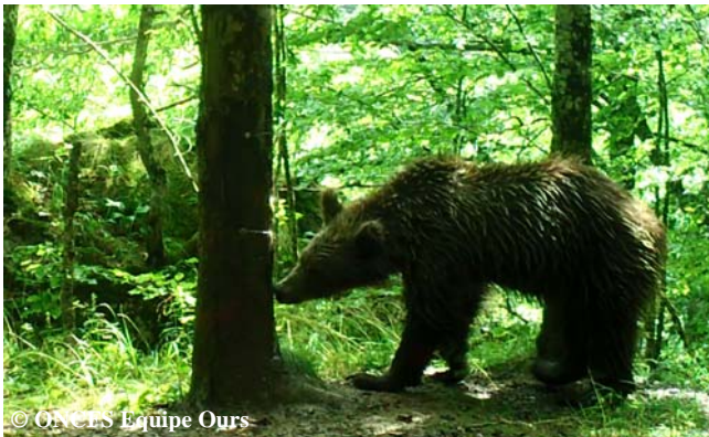
Photo automatique d'un ours subadulte, le 31 juillet 2015, commune de Seix (09).

26 séries de photos-vidéos automatiques ont été relevées courant août 2015. Les documents photographiques obtenus ont permis de détecter un minimum de 10 ours différents: Pyros, Cannellito, 1 femelle et 1 mâle adultes indéterminés, 2 subadultes de 1,5 an, 2 de 2,5 ans ainsi qu'une femelle et son ourson de l'année.