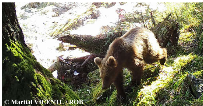
Photo automatique d'un ours subadulte de 1,5 an, réalisée le 05 mai 2016 sur la commune de Melles (31).