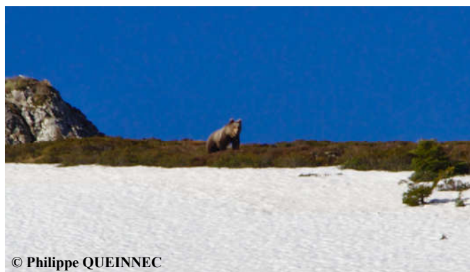
Ours observé le 16 mai 2016 sur la commune de Bagnères de Bigorre (65).

Une sélection de photos et vidéos automatiques, classée par mois, est consultable sur notre site internet ONCFS ainsi que sur la chaîne Youtube ONCFS .