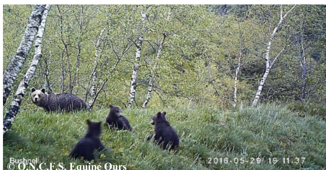
Photo extraite d'une vidéo automatique réalisée le 29 mai 2016 sur la commune de Bonac Irazein (09).