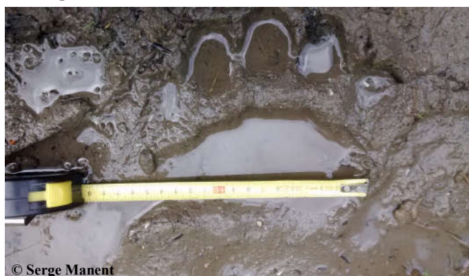
Photo de l'empreinte de l'ours Goiat réalisée lors de la vérification du témoignage, commune de Cazaux Layrisse (31).

Une sélection de photos et vidéos automatiques, classée par mois, est consultable sur notre site internet ONCFS ainsi que sur la chaîne Youtube ONCFS .