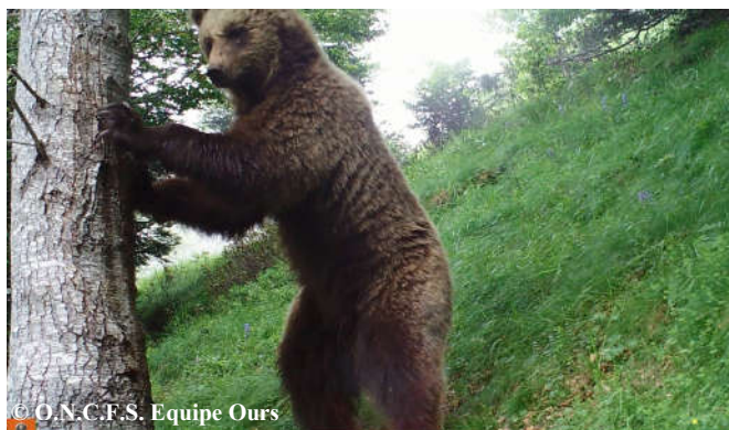
Photo d'un jeune mâle urinant au pied de l'arbre, extraite d'une vidéo automatique, réalisée le 06 juillet 2016 sur la commune de Sentein (09).

28 séries de photos-vidéos automatiques ont été relevées courant juillet 2016. Les données obtenues ont permis de détecter au moins 6 individus : Pyros, Néré, Cannellito, Hvala, 1 jeune mâle (photo ci-contre) et un ours de taille femelle adulte. Les 1er et 3 juillet, 2 séries de photos (dont une avec empreinte associée), relatives à 2 individus différents, probablement Cannellito et Néré, ont été obtenues sur Luz St Sauveur dans les Hautes-Pyrénées. C'est la première donnée de présence de Néré relevée sur la rive droite du gave de Gavarnie depuis 2001.