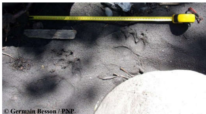
Empreintes d'un ours mâle indéterminé photographiées le 09 juillet 2016 sur la commune de St Lary Soulan (65).

Le 08 juillet, une piste d'ours est découverte sur les berges de la Neste, commune de St Lary Soulan dans les Hautes-Pyrénées. Dans un premier temps, l'ours Goiat fut suspecté car ayant été localisé par GPS les jours précédents, sur la commune de Gouaux, toujours en vallée d'Aure. Toutefois, les données GPS transmises plusieurs jours après (faute de couverture GSM) par l'équipe de suivi espagnole, révéleront que Goiat n'a jamais été localisé à moins de 8 km de ce secteur limitrophe de la commune de Tramezaïgues. Les relevés d'empreintes, réalisés le lendemain par le Parc National des Pyrénées lors de la vérification du témoignage, permettent aussi de constater que les dimensions de ces dernières (photo ci-contre) correspondent à la classe de taille d'un mâle adulte mais d'un gabarit inférieur de celui de l'ours Goiat. Néanmoins, aucun indice biologique (poils, crottes) n'a pu être collecté pour un éventuel génotypage. L'hypothèse d'un ours provenant de la population des Pyrénées centrales semble la plus probable au vu des deux pistes d'ours (non attribuables à Goiat) relevées depuis le début de l'année entre la Garonne et le département des Hautes-Pyrénées (voir Echos des Tanières n° 25 et 26).