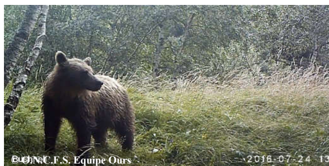
Photo d'un ours subadulte, extraite d'une vidéo automatique, réalisée le 24 juillet 2016 à Bonac Itrazein (09).