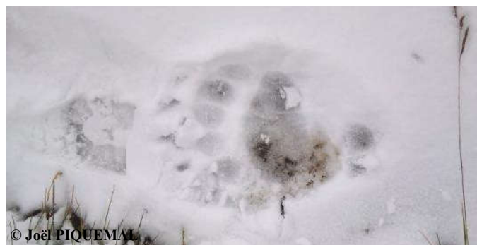
Empreinte d'une patte avant gauche d'un ours de taille moyenne sur la trace de chaussure de monsieur Piquemal, le 18 septembre 2016, commune d'Auzat (09).

Une sélection de photos et vidéos automatiques, classée par mois, est consultable sur notre site internet ONCFS ainsi que sur la chaîne Youtube ONCFS .