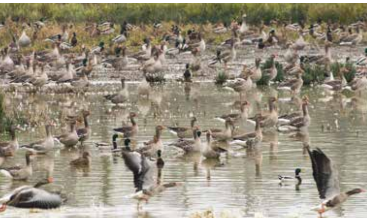
■ Oies cendrées et canards colverts