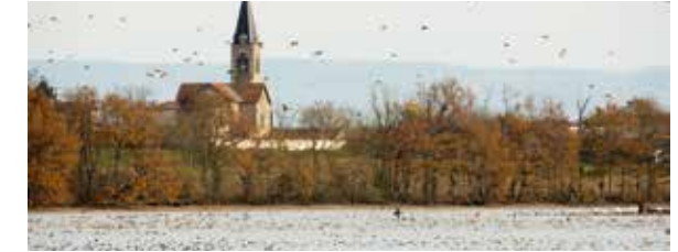
■ Remise diurne d'anatidés sur l'étang