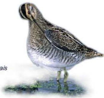
Bécassine des marais