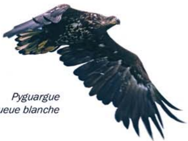
Pyguargue à queue blanche