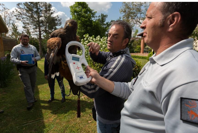
Contrôle d'un établissement détenant de la faune sauvage

Le rapport d'activité 2018 de l'Office national de la chasse et de la faune sauvage (ONCFS) pour la délégation interrégionale Hauts-de-France Normandie vient de paraître. Dans l'Eure, ce sont plus de 127 infractions qui ont été relevées l'année passée, représentant 74 procédures judiciaires.