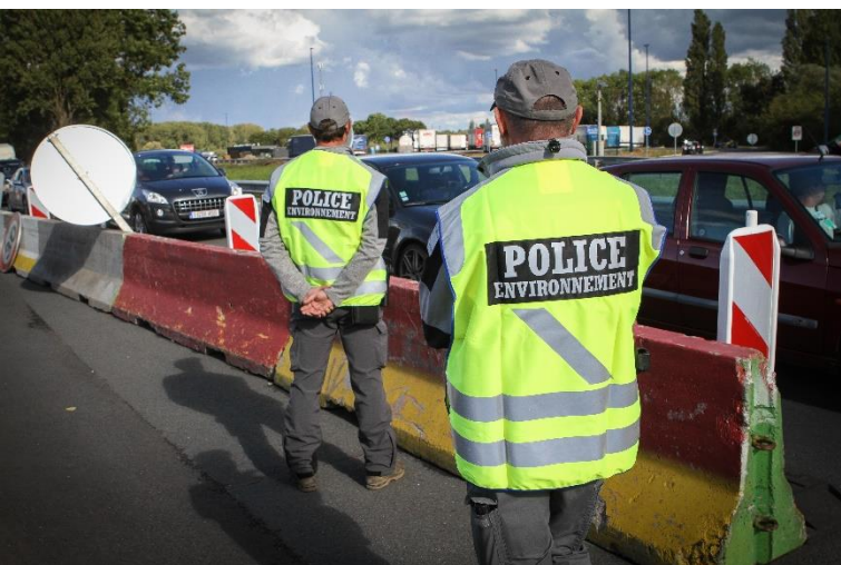
Inspecteurs de l'environnement de l'ONCFS

Le rapport d'activité 2018 de l'Office national de la chasse et de la faune sauvage (ONCFS) pour la délégation interrégionale Hauts-de-France Normandie vient de paraître. Dans le Nord, ce sont plus de 300 infractions qui ont été relevées l'année passée, représentant 190 procédures judiciaires.