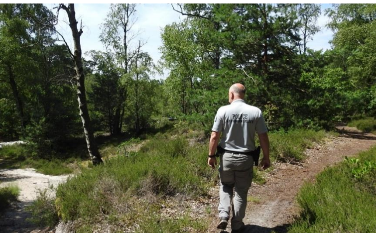
Inspecteur de l'environnement de l'ONCFS

Le rapport d'activité 2018 de l'Office national de la chasse et de la faune sauvage (ONCFS) pour la délégation interrégionale Hauts-de-France Normandie vient de paraître. Dans l'Oise, ce sont plus de 373 infractions qui ont été relevées l'année passée, représentant 281 procédures judiciaires.