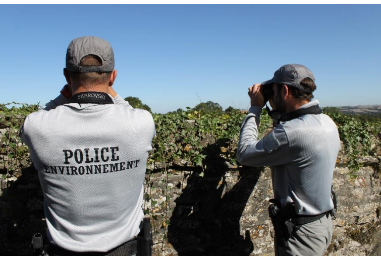
Inspecteurs de l'environnement de l'ONCFS

Le rapport d'activité 2018 de l'Office national de la chasse et de la faune sauvage (ONCFS) pour la délégation interrégionale Hauts-de-France Normandie vient de paraître. Dans l'Orne, ce sont plus de 180 infractions qui ont été relevées l'année passée, représentant 153 procédures judiciaires.