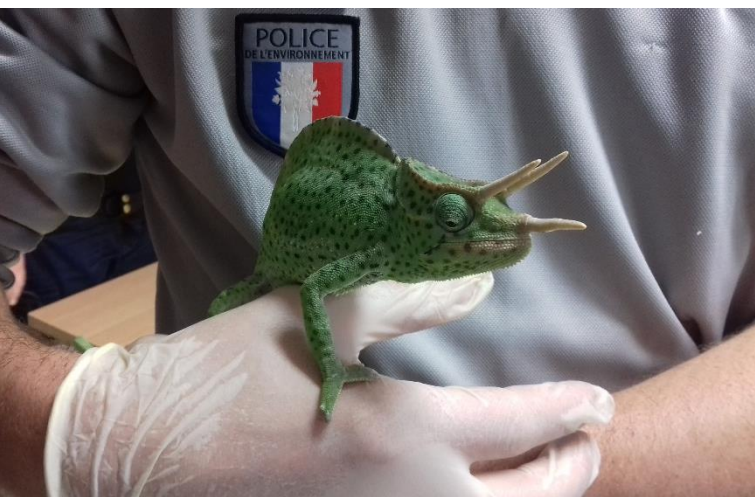
Saisie de caméléons

Le rapport d'activité 2018 de l'Office national de la chasse et de la faune sauvage (ONCFS) pour la délégation interrégionale Hauts-de-France Normandie vient de paraître. Dans le Pas-de-Calais, ce sont plus de 349 infractions qui ont été relevées l'année passée, représentant 201 procédures judiciaires.