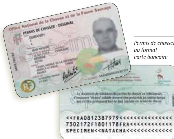
Permis de chasser au format carte bancaire