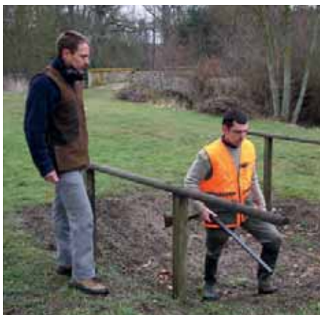
Évolution sur un parcours de chasse

Rangement d'une arme de chasse dans un véhicule.