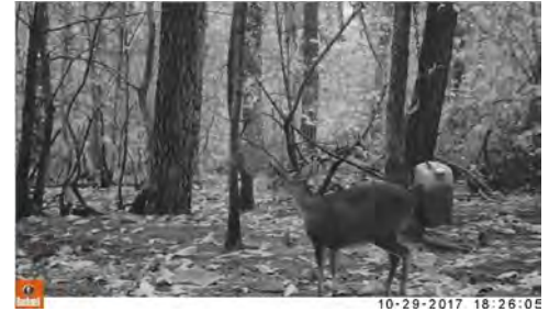
Muntjac de Reeves capturé par piège photo

Afin de prévenir un fort développement de cette population, la seule connue de France, des mesures de lutte ont été mises en œuvre sous la forme de battues administratives mais sans succès. L'expérience anglaise en la matière nous sera utile pour parvenir à maîtriser totalement ces animaux