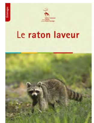
Collection éclairages : le Raton laveur