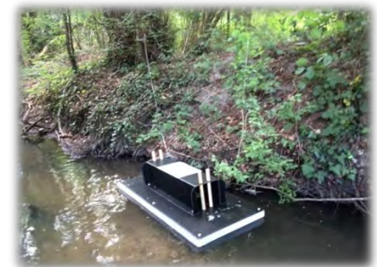
Radeau à empreinte