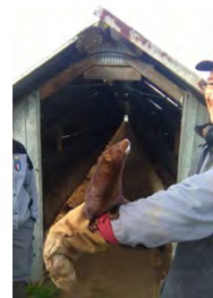
Vison d'Amérique d'élevage