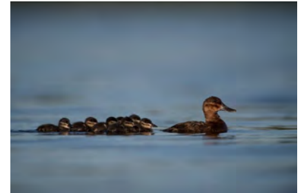
Nichée d'Érismature rousse @ E. Médard