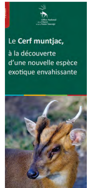
Collection focus : le Cerf muntjac