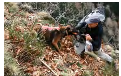
Iris et son maître

de cette technique pour la détection du menacé Vison d'Europe et de l'envahissant Vison d'Amérique est en test par l'ONCFS avec la chienne Iris, expérimentée sur la détection de crottes d'ours.