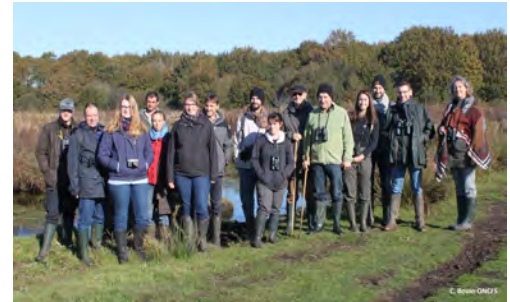
Stage 2017 en Brière

Enfin, un guide technique pour la reconnaissance de la faune exotique envahissante sur le bassin de la Loire, verra le jour courant 2018.