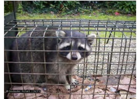
Raton laveur

également les tubercules, la banane, la canne à sucre et se sert dans les élevages de volailles. L'espèce a été récemment retirée de la liste des espèces protégées de ce département (arrêté du 17 janvier 2018).