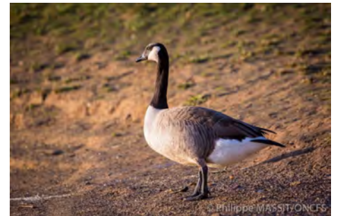
Bernache du Canada ( Branta canadensis )

Malgré ces mesures, la population de bernache poursuit sa croissance à l'échelle nationale. Depuis 2009, 6 nouveaux départements ont été colonisés par cette espèce ; le département des Ardennes présentant la plus forte augmentation d'effectifs de bernache. Les parcs urbains et bases de loisirs constituent des espaces favorables pour cette espèce. Un projet de gestion intégrée dans le département des Ardennes est actuellement à l'étude avec les partenaires locaux et la Wallonie. Ce sera l'occasion de tester et mettre