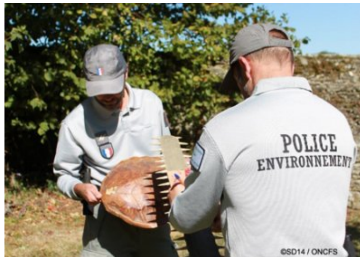
Inspecteurs de l'environnement de l'ONCFS

Basés à Mézidon vallée d'Auge et Seulline, les agents du service départemental ONCFS sont quotidiennement sur le terrain pour faire respecter le code de l'environnement et mener des études sur la faune sauvage et ses habitats. Que ce soit la police de la chasse, le respect des espaces protégés, le contrôle de la vente et de la détention d'espèces de faune et flore protégées ou le contrôle de la circulation des véhicules à moteur dans les milieux naturels, les missions de police représentent 90 % de leur temps d'activité.