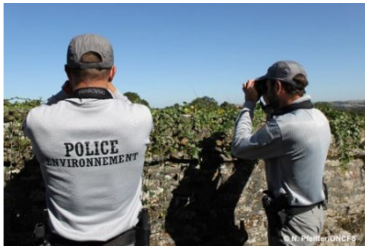
Inspecteurs de l'environnement de l'ONCFS

Le rapport d'activité 2018 de l'Office national de la chasse et de la faune sauvage (ONCFS) pour la délégation interrégionale Hauts-de-France Normandie vient de paraître. Dans l'Orne, ce sont plus de 180 infractions qui ont été relevées l'année passée, représentant 153 procédures judiciaires.