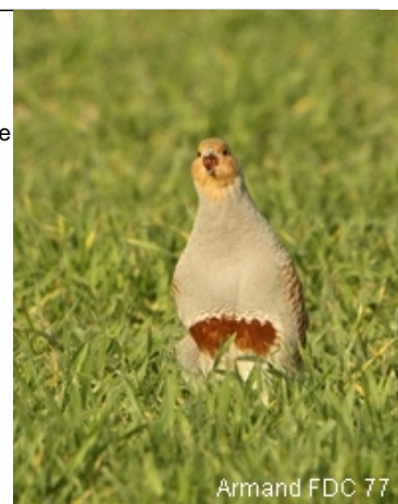
Coq territorial de perdrix grise

Tenu en main. Pour un oiseau de plus de 3-4 mois tenu en main, l'observation des plumes scapulaires permet également de déterminer le sexe de l'oiseau : les rayures sont en croix de Lorraine chez la poule tandis que les raies sont simples chez le coq.