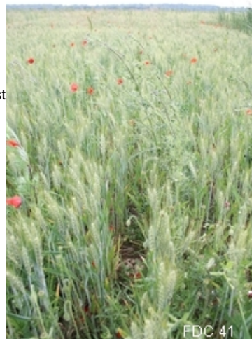
Nid éclos de perdrix grise FDC 41

Pendant ce temps, les coqs veillent à proximité des nids. L'immobilité des poules les rend sensibles au machinisme agricole et à la prédation. Les pontes commencent à éclore vers la mi-juin. L'éclosion des oeufs d'un même nid est synchrone, les poussins quittent le nid après quelques heures (ils sont nidifuges) et forment avec les parents un groupe familial appelé compagnie.