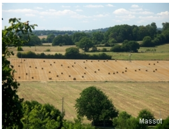
Bocage du Perche

Une enquête récemment menée par P. Mayot a fait le point, région par région, sur la gestion des territoires pour la perdrix grise.