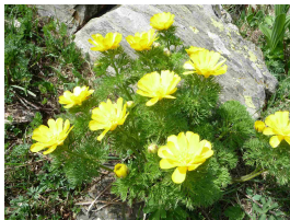
Adonis des Prénées

Le partenariat ONCFS Languedoc-Roussillon / Conservatoire Botanique National Méditerranéen de Porquerolles (CBNM) est fondé par la mise en place d'une Convention-Cadre entre les deux établissements en 2004.