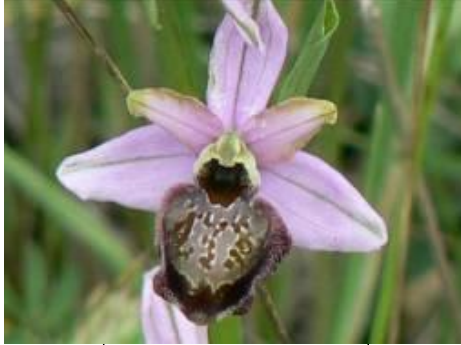
Ophrys de l'Aveyron

2003 est l'année de création d'un réseau botanique en région Languedoc-Roussillon.