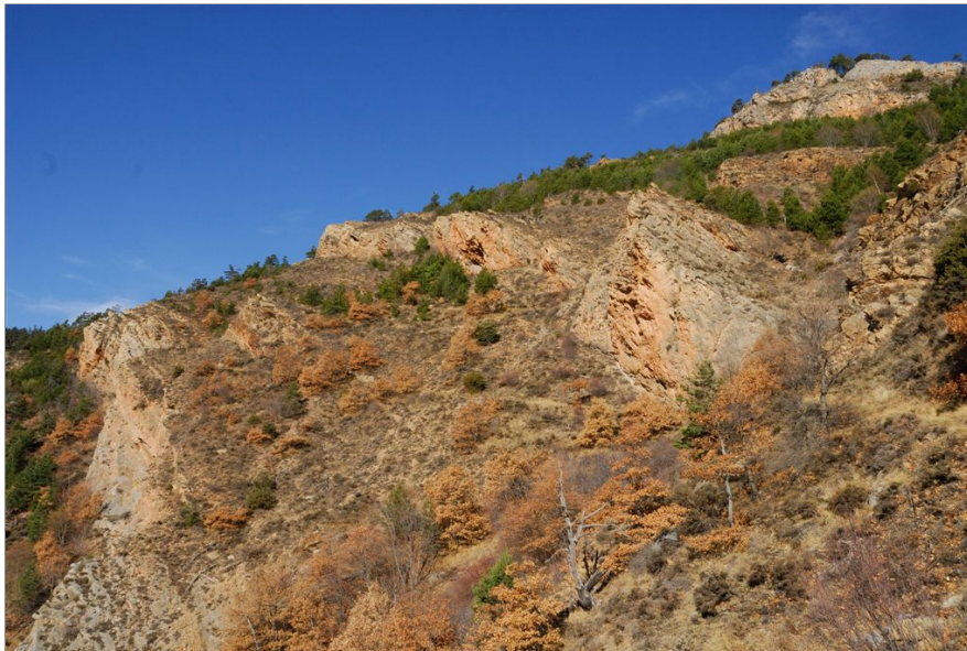
Schistes et masses calcaires caractérisent la réserve.