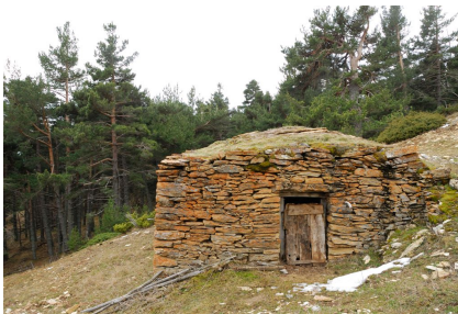
Abri de pierre

La Réserve Naturelle Nationale occupe le nord de la commune de Jujols (Pyrénées-Orientales), sur le flanc sud-est du Mont Coronat. Elle débute à 1100m d'altitude et atteint le sommet du Mont Coronat à 2172 m, dominant la vallée de la Têt. Ce territoire protégé de 472 ha est mitoyen de la Réserve Naturelle Nationale de Nohèdes.